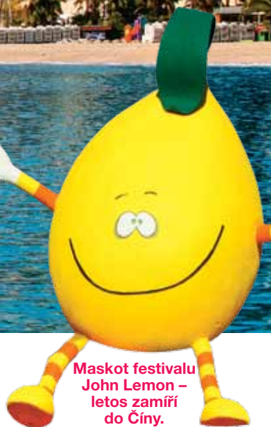
Maskot festivalu John Lemon – letos zamíří do Číny.

vidíte i všude jinde. Citronový sirup, bonbon i marmeládu asi známe všichni, ale zkusili jste třeba citronový šampon na vlasy či sardinky s citronovou kůrou? Delikatesa! Nemluvte o tom, že takřka celé město se zbarví do žlutooranžové barvy – fasády domů, výklady, pouliční stánky i výzdoba místních restaurací.